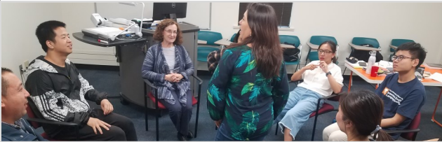
Uma sessão de 8 semanas

*Seminários especiais oferecidos: Inglês para Negócios, Inglês para Engenharia, Turismo e Inglês para Profissionais da Saúde.